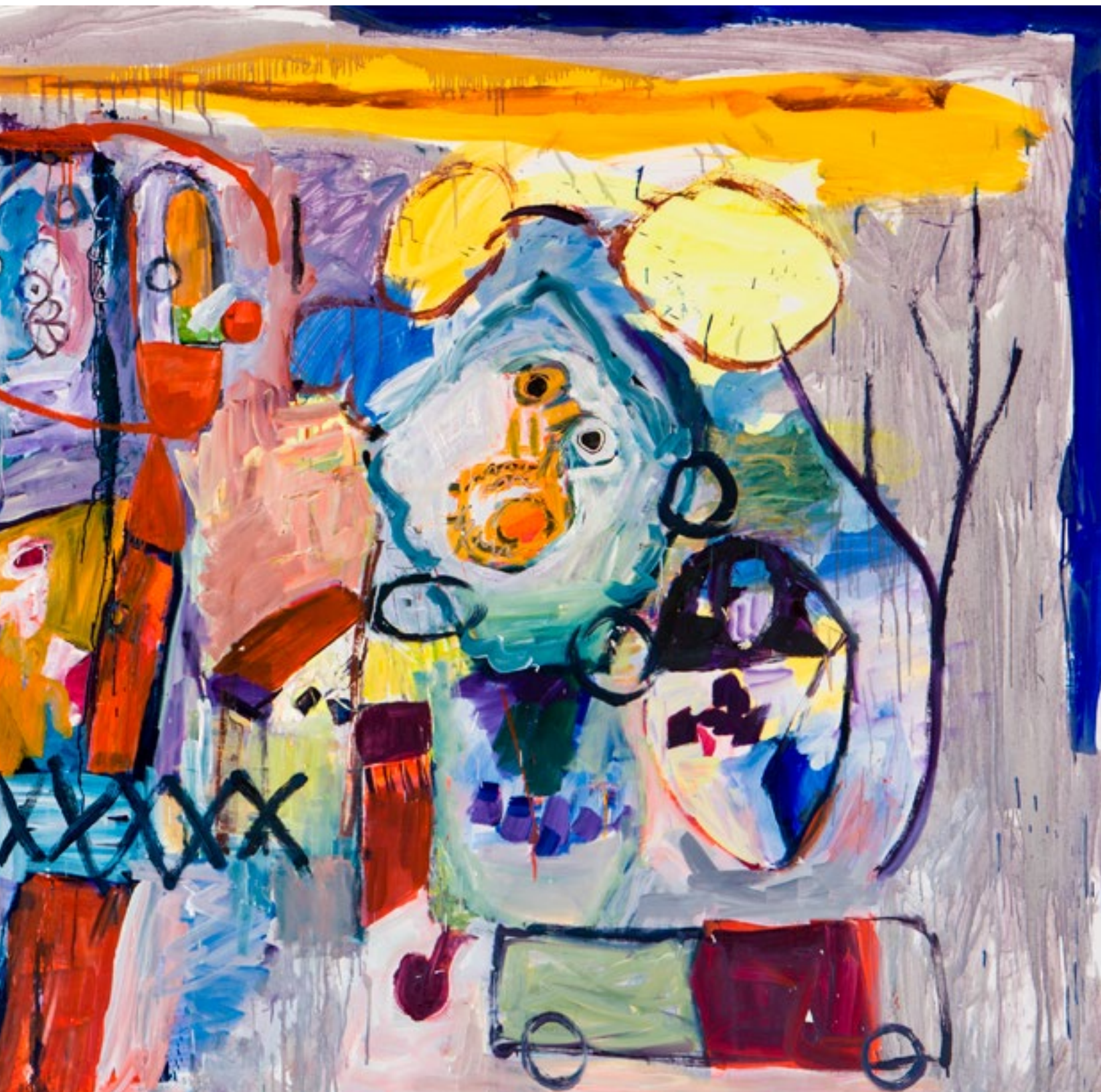
Óleo sobre lienzo 300 x 150 cm