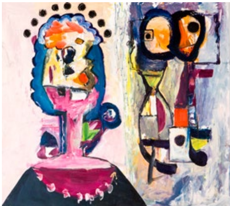
Óleo sobre lienzo 100 x 120 cm