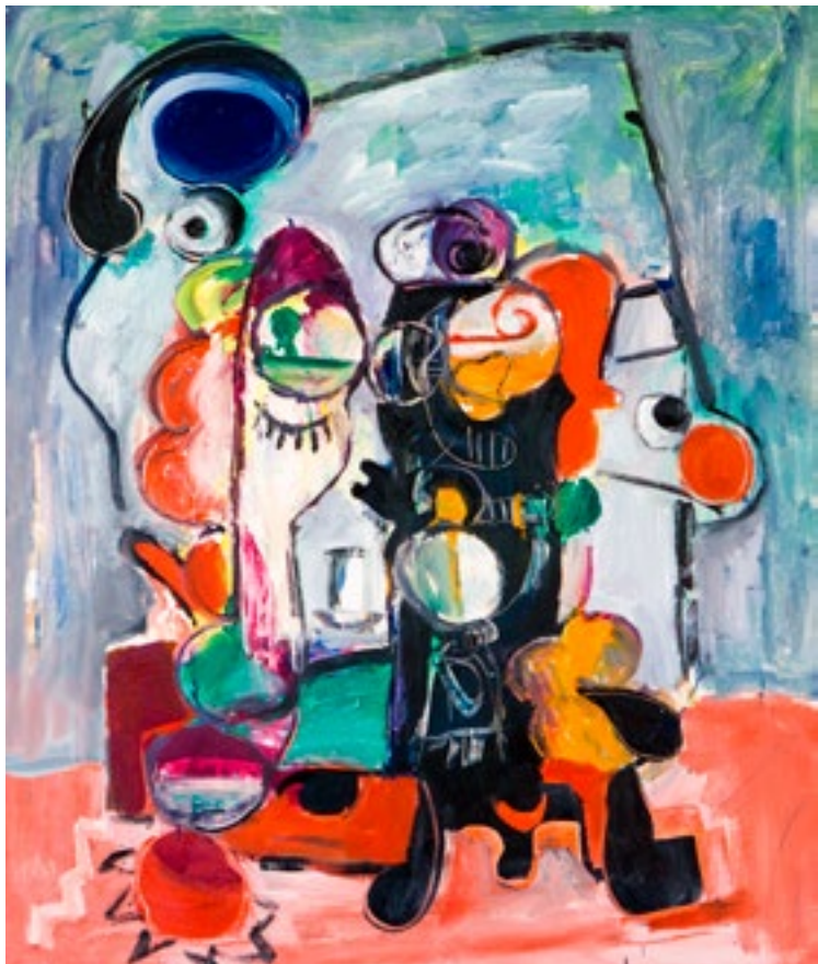
Óleo sobre lienzo 120 x 100 cm