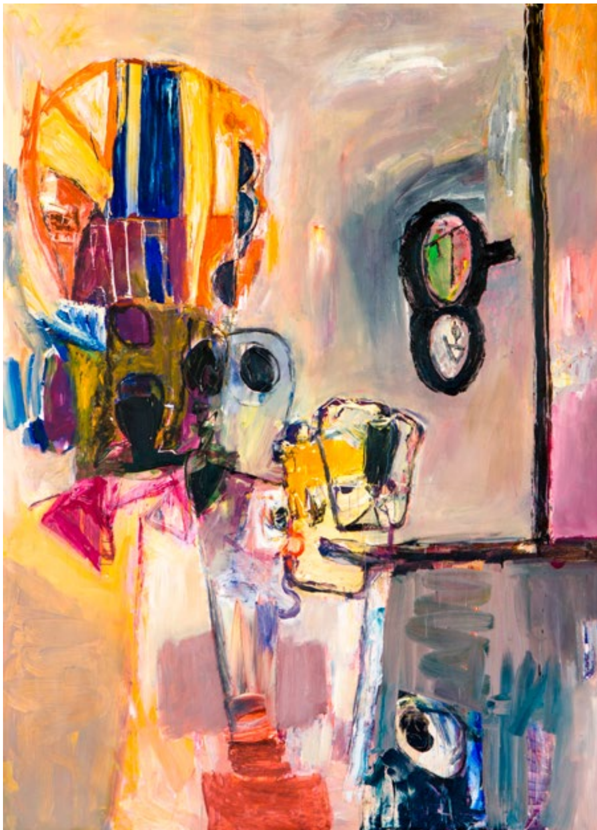
Óleo sobre lienzo 162 x 130 cm