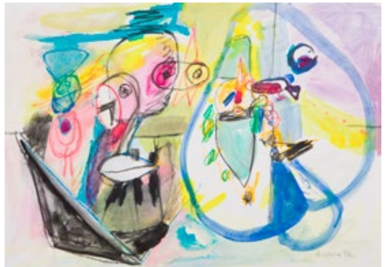
Témpera sobre papel 30 x 42 cm