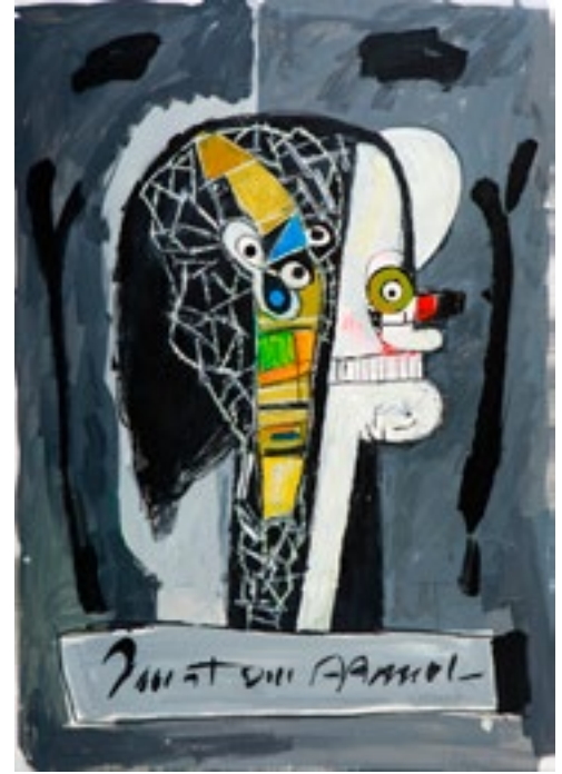
Conjunto de 10 témperas sobre papel 70 x 50 cm/u