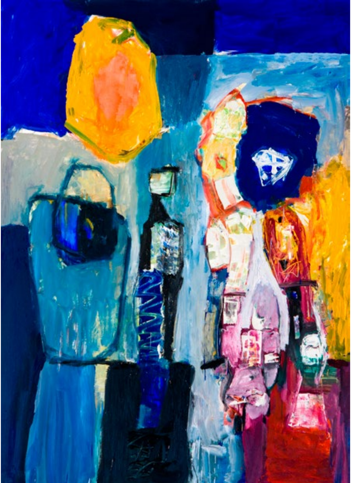
Óleo sobre lienzo 162 x 130 cm