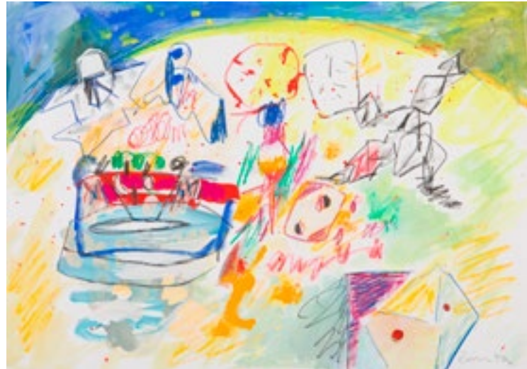
Témpera sobre papel 30 x 42 cm