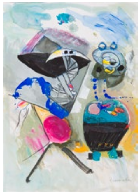
Témpera sobre papel 42 x 30 cm