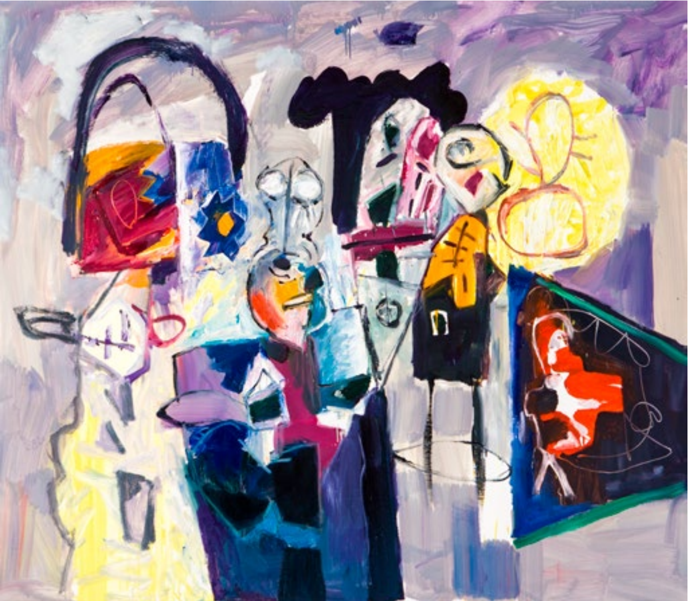
Óleo sobre lienzo 130 x 162 cm