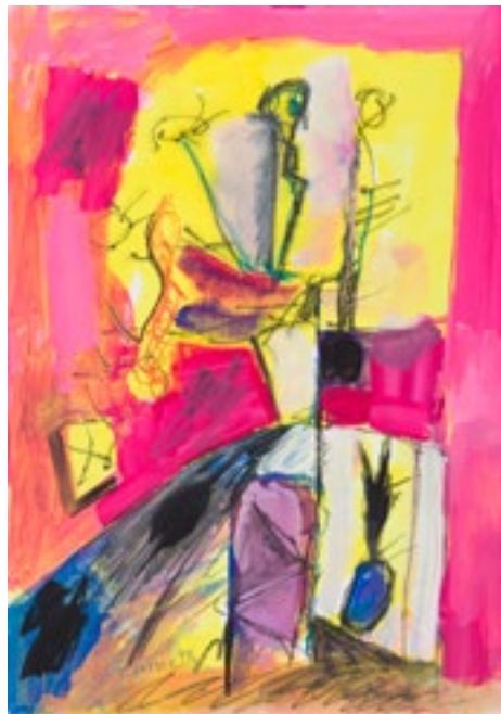
Témpera sobre papel 42 x 30 cm